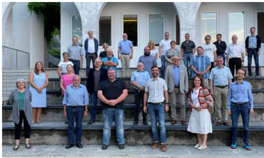
letzte Gemeinderatssitzung vor der Sommerpause am 24.6.2021